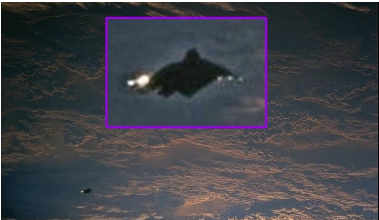
Vên tinh “Hiệp Sĩ Đen”.

Trong hơn một thế kỷ qua, đã có những tín hiệu từ một vệ tinh 13.000 năm tuổi của “người ngoài hành tinh” luôn thăm dò xung quanh Trái đất chúng ta. Nó nổi tiếng với tên “Hiệp Sĩ Đen”. Vậy mục đích của những người gửi vệ tinh thăm dò này là gì?