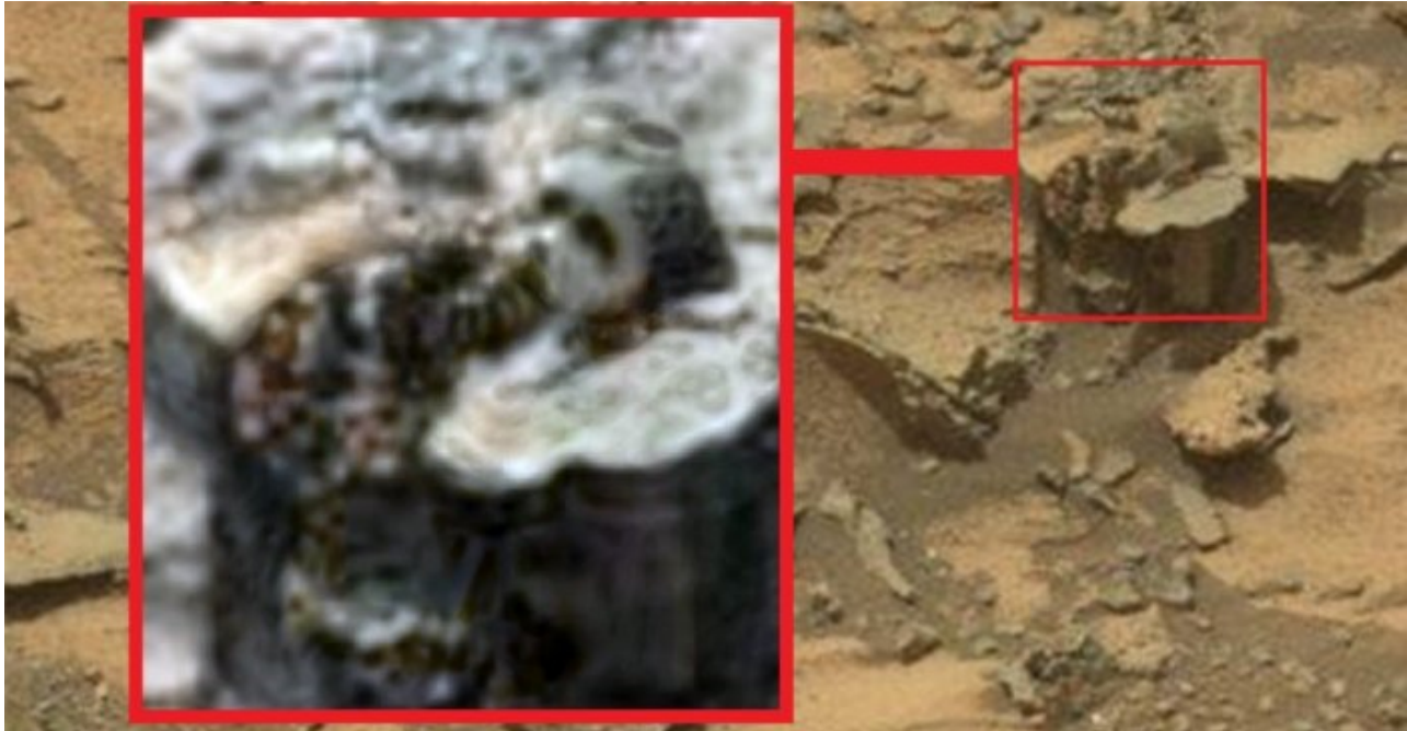
Hình ảnh giống hài cốt trên sao hỏa.

tin đã tuyên bố tìm thấy bằng chứng về cây cối, nước, kim tự tháp, đường ống, các tòa nhà và các vật thể bí ẩn cùng vô số những điều dị thường mà đáng ra không thể xuất hiện tại đây.